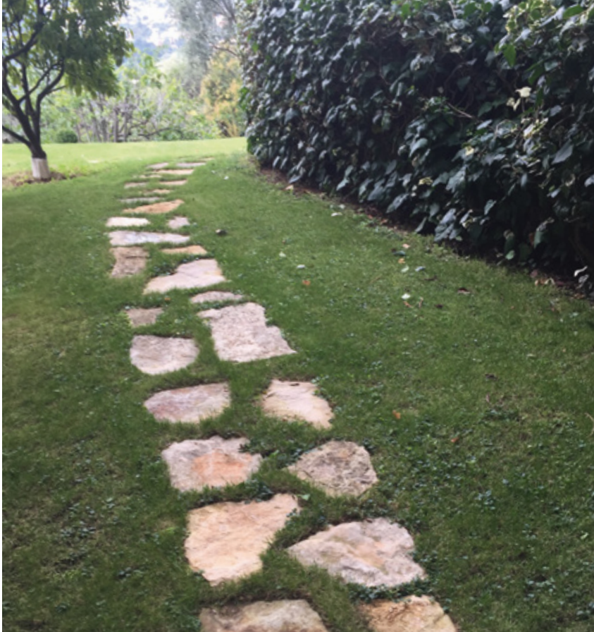
PAS DE MULES CERNON